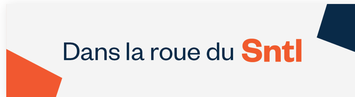
En-tête de la newsletter

Afin de maintenir un lien fort avec ses adhérents , le Snti publie une newsletter mensuelle . Elle les informe de l'avancement des projets et des combats en cours, de l'actualité générale du secteur, des évolutions juridiques et économiques, des nouveautés chez nos partenaires.